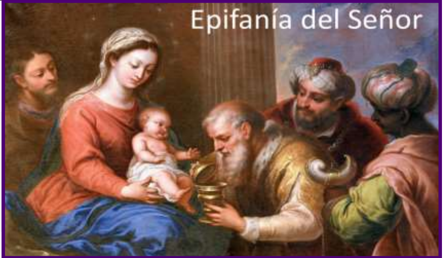
Epifanía del Señor